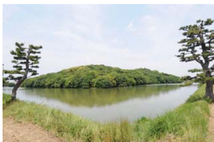
ミンザイ古墳(伝履中陵)