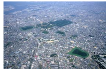
百舌鳥古墳群上空写真