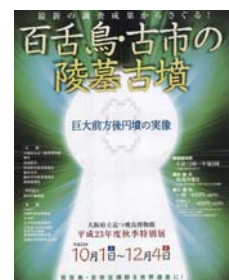
特別展『最新の調査からさぐる—