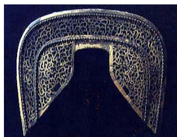
菅田八幡宮・宝物部