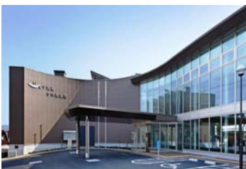
今城塚併設の古代歴史館

「倭の五王と巨大古墳」をテーマした古墳築造技術の紹介、西墓山古墳や津堂城山古墳出土の日本最大級かつ最古級の「水鳥形埴輪」、「船型埴輪」などを展示しています。