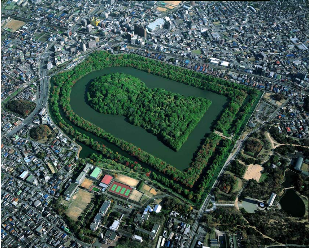
大仙陵古墳（伝仁徳天皇陵）上空写真

2011年11月15日(火)－17日(木) 3日間 『大阪・河内の大王陵をめぐる』